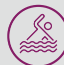
Piscina para adultos y niños