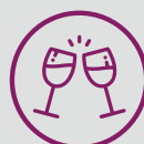
Salón social climatizado