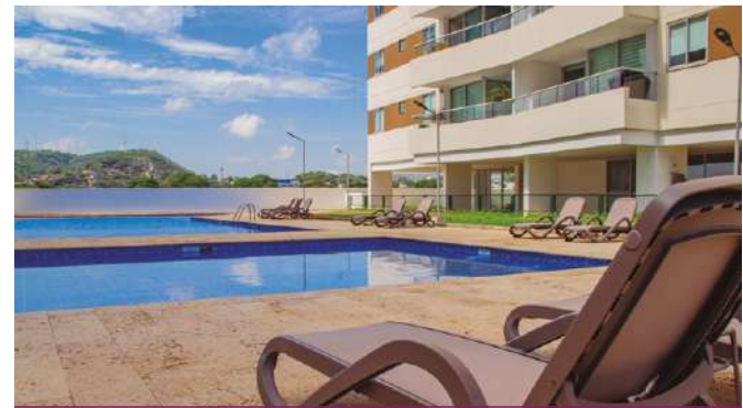
Piscina para niños y adultos