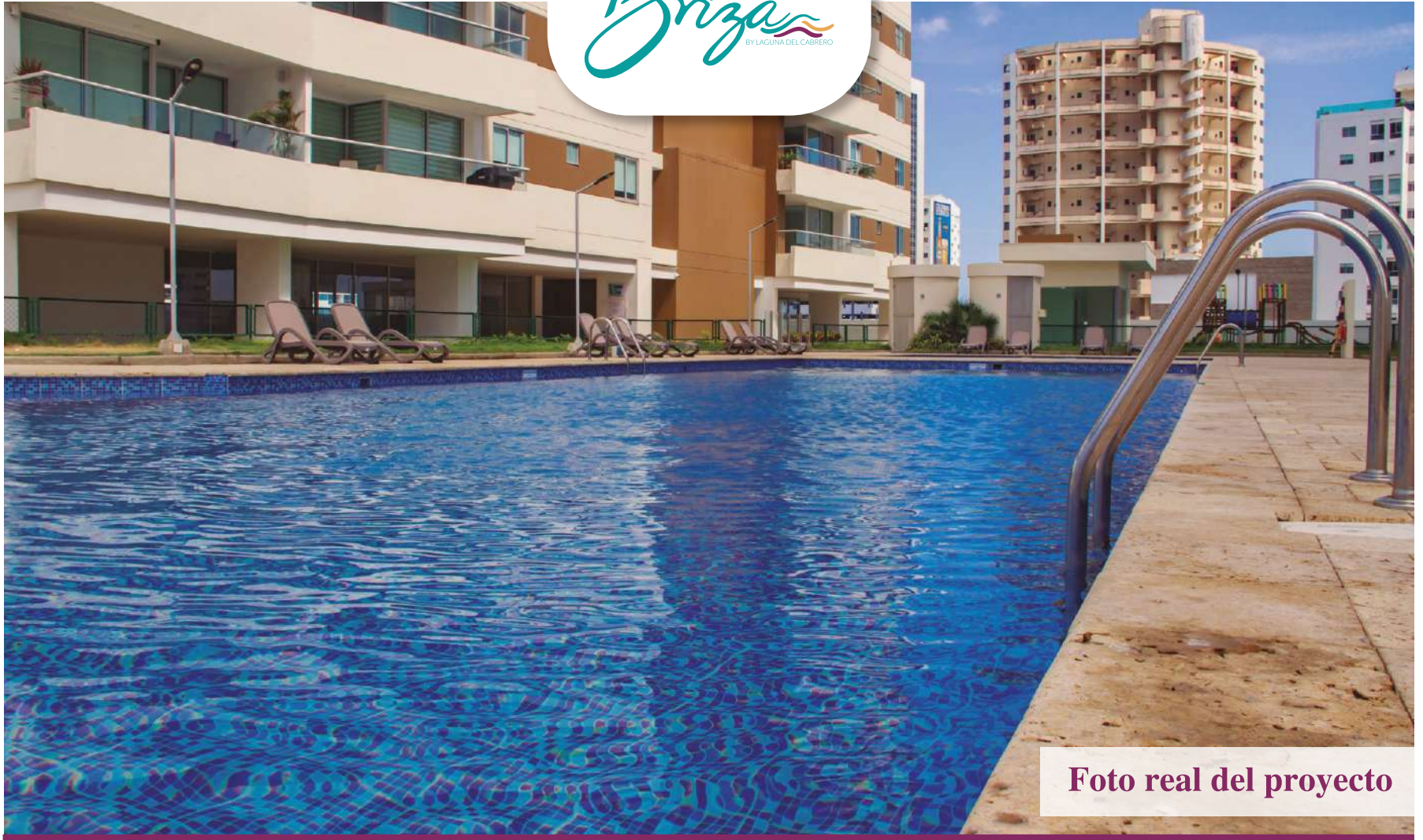
Foto real del proyecto